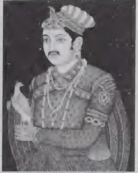
ಮೊಗಲ್ ಚಕ್ರವರ್ತಿ ಅಕ್ಬರ್

ಚಾಂದ್ ಬೀಬಿ ಬಿಜಾಪುರದ ಅರಸು ಇಬ್ರಾಹಿಂ ಹಾಗೂ ಗೋಲ್ಕೊಂಡದ ಕುತುಬ್ ಶಹರಲ್ಲಿ ಸಹಾಯ ಕೇಳಿದಳು. ಮೊದಲಿನಿಂದಲೂ ಚಾಂದ್ ಬೀಬಿ ಕುರಿತು ಹೆಚ್ಚಿನ ಗೌರವ- ಪ್ರೀತಿಗಳನ್ನು ತಳೆದಿದ್ದ ಇಬ್ರಾಹಿಂ ಆದಿಲ್ ಶಹನು ತಡಮಾಡದೆ ಮೂವತ್ತು ಸಹಸ್ರ ಸೈನಿಕರನ್ನು ಕಳಿಸಿದನಂತೆ! ಗೋಲ್ಕೊಂಡದಿಂದಲೂ ಏಳುಸಾವಿರ ಸೈನಿಕರ ಪಡೆ ಬಂದಿತು. ಹೆಚ್ಚಿನ ಸರದಾರರೂ, ಜನತೆಯೂ ಚಾಂದ್ ಬೀಬಿಯ ಬೆಂಬಲಕ್ಕಿದ್ದರು. ಕೆಲವೇ ಬಂಡೆದ್ದ ಸರದಾರರನ್ನು ಗಡೀಪಾರು ಮಾಡಲಾಯಿತು.